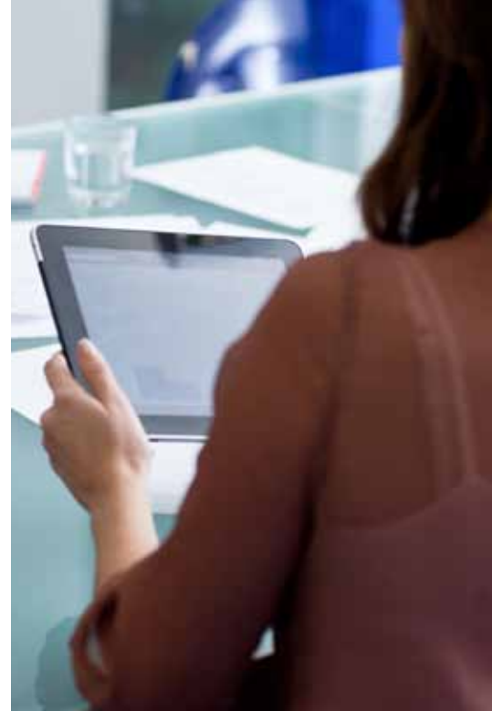
Abbildung 1. Portfolio der Alcatel-Lucent OpenTouch™ Suite für KMU

Das Portfolio ist zuverlässig, offen und basiert auf Standards. Die Alcatel-Lucent OpenTouch™ Suite für KMU ist auf allen Ebenen modular – von Kommunikationspaketen und Softwarelizenzen bis hin zu Kommunikations-Servern und Netzwerk-Infrastrukturen, die die Anforderungen der Kunden genau erfüllen. Sie können dieses Portfolio mit einer Hardwaregarantie und zahlreichen Leistungen erwerben: vom einfachen Wartungsvertrag bis zur kompletten Systemaufrüstung für neue Anwendungen und Technologien. Die Alcatel-Lucent OpenTouch™ Suite für KMU ist zukunftsorientiert, basiert auf einem leistungsstarken und flexiblen IP-Kommunikations-Server mit Standardprotokollen, der OmniPCX™ Office Rich Communication Edition (RCE), und bietet eine Reihe leistungsfähiger Merkmale.